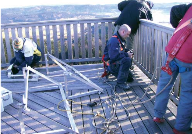
Foto: Arbeiter der Firma Schmid, der Firma Miniberger, Firma HEGA sowie des Gemeindebauhofes bei der Montage der Webcam.

Ein Link zur Webcam ist auf der Startseite der Gemeindehomepage zu finden.