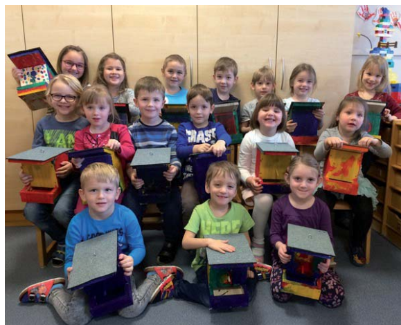
Bild: Die Kinder der Bärengruppe mit den Vogelhäusern.

Die Kinder haben sich sehr darüber gefreut, diese nach eigenen Vorstellungen bunt bemalt und sind sehr stolz auf ihre tollen Werke!