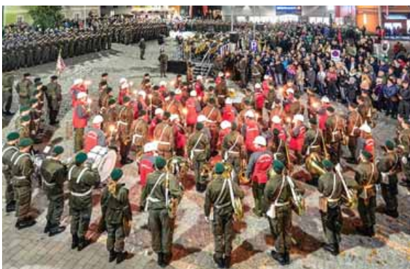
Einer der Höhepunkte im heurigen Veranstaltungskalender war die Angelobung der Rekruten der 4. Panzergrenadierbrigade mit der Militärmusik Oö. am 9. November auf dem neuen Marktplatz.