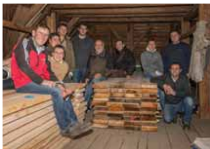
Die freiwilligen Helfer am Dachboden des Schlosses.

Mehr als 4000 kg wurden drei Stockwerke hoch geschleppt!