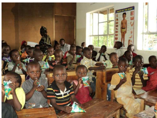
Weihnachtsfeier 2012 in der neuen Schule

Um unseren 177 Patenkindern in Tansania wieder eine Weihnachtsfeier mit einem Weihnachtsgeschenk von den PatInnen aus Österreich zu ermöglichen, wird pro Patenkind ein Betrag von € 10,- an P.Athanasius überwiesen. Er kauft dann in Tansania, was die Patenkinder am Notwendigsten brauchen (Kleidung, Schuhe, Wäsche, o.ä.). Liebe PatInnen, bitte den Betrag bis Anfang Dezember in die Pfarrkanzlei bringen oder mit dem Patenbeitrag 2014 mitüberweisen, der dann im Jänner fällig ist.