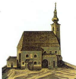
Ansicht der Kirche um 1840