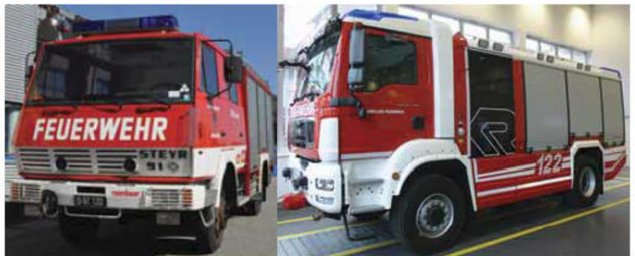
Das derzeit in Dienst stehende Fahrzeug, Baujahr 1985.

Wir ersuchen Sie, den Ankauf des neuen Fahrzeuges mit einer Spende zu unterstützen.