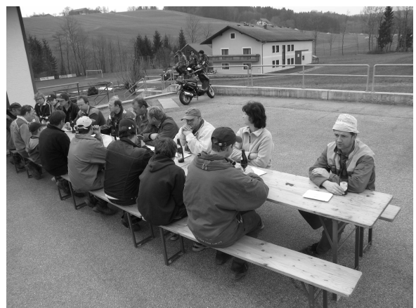
Nach getaner Arbeit gab es eine Stärkung