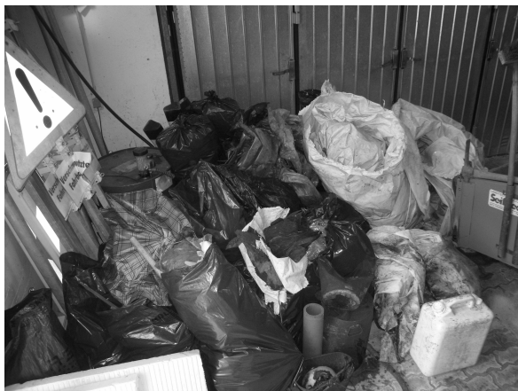
Der gesammelte Müllberg

Die Gemeinde bedankt sich bei allen, die sich weiterhin um einen sauberen Ort bemühen.