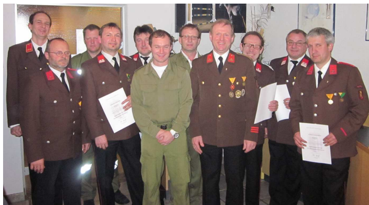
Im Bild die geehrten Feuerwehrkameraden